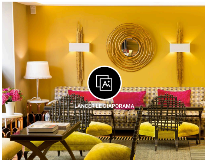
Le Baume : un hôtel à la décoration Art Déco