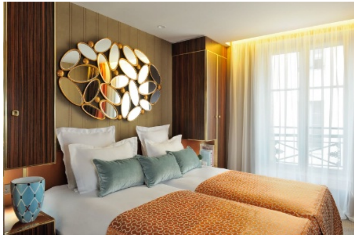
Chambre thème club.

Paris (Vie) L'établissement revisite l'ambiance des années 1930 en six thématiques déclinées à travers le choix des couleurs, des luminaires, du mobilier, des bibelots et des papiers peints.